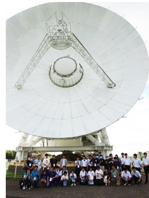
入来天文台全景 手前は国立天文台VERA 口径20m電波望遠鏡 左手奥に鹿児島大学口径1m光赤外線望遠鏡 (昼間見学受付中)