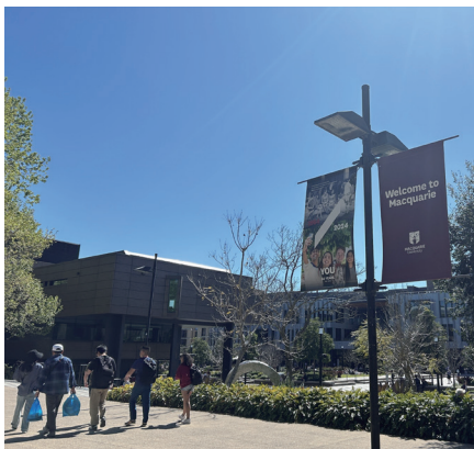
写真1：Macquarie University (MQ) 4万人以上の学生が在籍する大学です。