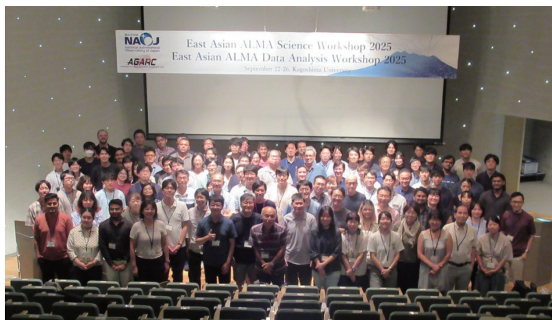
East Asian ALMA Science Workshop 2025 終了直後の全体写真

鹿児島で開催される国際研究会は、学生にとっては旅費や出張の手続きを心配することなく国際交流ができる、またとない機会です。今後も天の川センターの各教員が、国際研究会を主催していくはずですが、学生の皆さんには、こういった貴重な機会を逃すことのないように願っています。