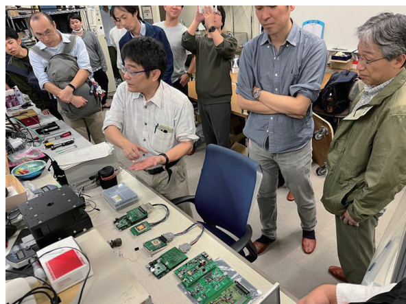
永山研究室 実験室見学の様子