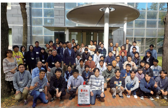
写真 1: VLBI 懇談会シンポジウム集合写真

シンポジウム集録 (プログラム情報含む) は、VLBI 懇談会 ホーム ページ ( https://www2.nict.go.jp/sts/stmg/vcon/ ) から公開されています。