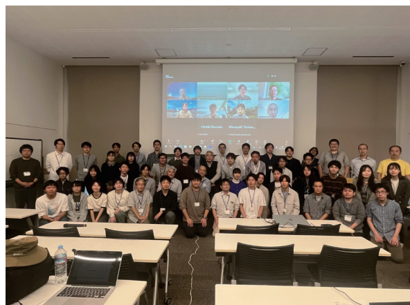
研究会参加者の集合写真

研究会終了後には、永山研究室の実験室見学が行われ、赤外線検出器の紹介に加え、自作を含む開発に役立つ工具類の紹介も行われ、好評でした。