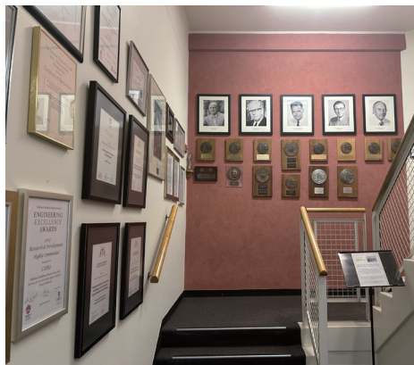
写真2：CSIRO Astronomy and Space Science (CASS) 館内。これまでの功績が展示されていました。