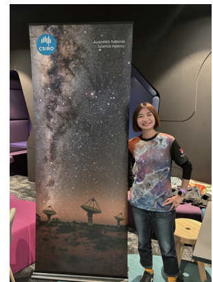
写真3：Astronomy Open Night（一般市民向けのイベント）にスタッフとして参加した際の記念写真。スタッフTシャツをいただきました。