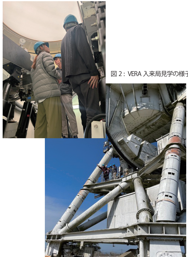
図2：VERA入来局見学の様子