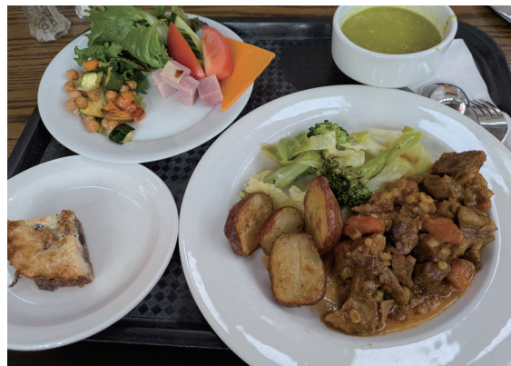
写真2：トロント大学構内の Massey College の食堂でのランチ