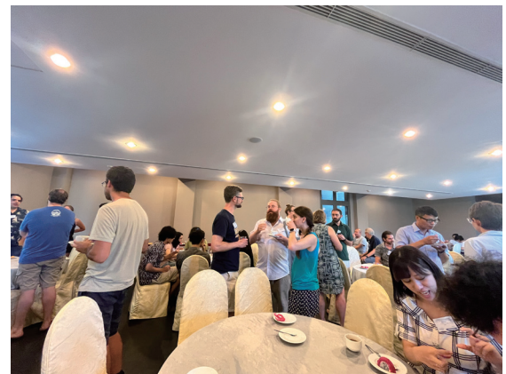
コーヒーブレイクの様子。フランクに交流できる時間がたくさんありました。

同じ会場では宇宙論の研究会も並行開催されており、食事やエクスカージョンの時間を共有できたことで、分野を超えた研究者と交流できたのも幸運でした。私は今後研究分野を離れる予定ですが、もしまた機会があるなら、ぜひ参加したいと思う研究会です。海外での研究会参加に不安がある学生さんにも、運営が行き届いている点で参加しやすく、国際発表の最初の一步としても強くおすすめします。